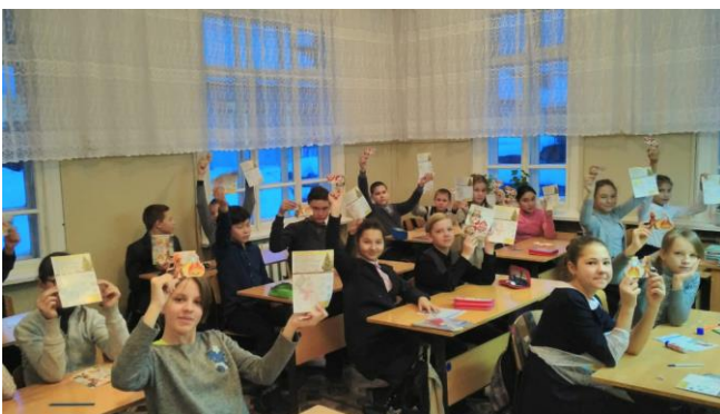
7-8 классы: «Правила поведения при пожаре в быту».