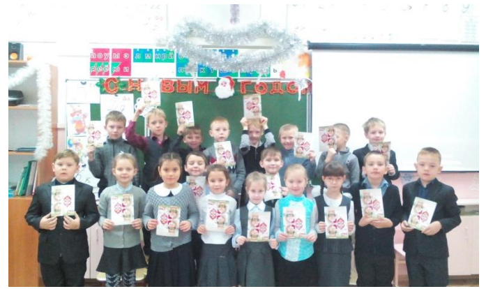
-2 класс: «Будь осторожен с огнем».