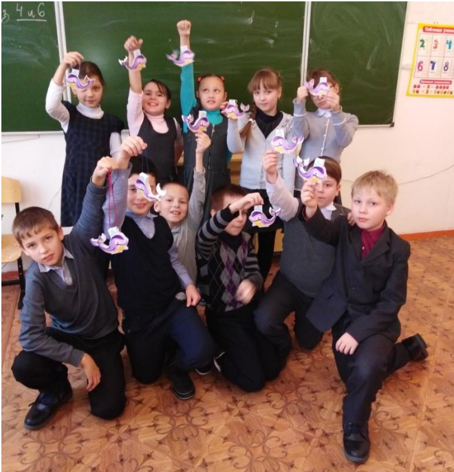
3-4 классы: «Берегись огня!»